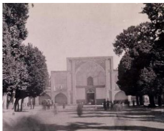
تصویر قدیمی از سردر عالی قاپو قزوین

جاهای دیدنی قزوین مانند سردر عالی قاپو تاریخچه های بسیار غنی ای دارند و بازدید از این مکان های تاریخی شبیه به سفر با ماشین زمان است. اگر فعلا شرایط بازدید از این بناهای تاریخی را ندارید امروز با ماشین زمان ما همراه باشید. این بنای تاریخی مربوط به دوران صفویه می باشد و در زمان حکومت شاه طهماسب ساخته شده است. پس از گذشت چند سال در زمان شاه عباس اول این بنا به شکل کنونی تغییر یافت. هم چنین در زمان حکومت ناصرالدین شاه و پهلوی اول و دوم تغییرات و تعمیرات زیادی روی این بنای تاریخی صورت گرفت.