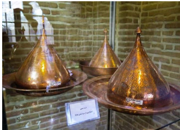
نمونه ای از ظروف مسی قدیمی واقع در موزه رختشویخانه زنجان

خودتان را درب ورودی رختشویخانه تصور کنید. داخل شوید. بله اینجا شاهکار جاهای دیدنی زنجان، یعنی رختشویخانه زنجان است. در ابتدا اتاق سرایداری را مشاهده میکنید که در زمان های قدیم اتاق نگهبان این رختشوی خانه بوده که در همان جا هم زندگی می کرده، جالب است بدانید که حتی نگهبان این رختشویخانه هم مهربانو (خانم) بوده. در حال حاضر که این مکان به موزه ی رختشویخانه تبدیل شده. این اتاق سرایداری به مکانی برای به نمایش گذاشتن آثار تاریخی و اشیا تاریخی تبدیل شده است. وقتی وارد این اتاق می شوید میتوانید چاقو های دست ساز معروف زنجان، تابلوهای منبت کاری و ظروف قدیمی مسی و .... را ببینید.