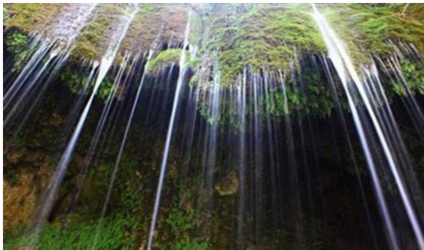
غار لادیز میرجاوه زاهدان

جاهای دیدنی زاهدان و طبیعت آن بسیار زیاد است و غار لادیز میرجاوه یکی از زیباترین آن هاست. یکی از چیزهایی که غار لادیز میرجاوه زاهدان را جالب تر می کند این است که این غار از دل کوه بیرون آمده است. این غار که جزو پرترفدارترین جاهای دیدنی زاهدان است، در ۲۵ کیلومتری شهر میر جاوه به تمین و روستای لادیز قرار دارد. روستای لادیز و شهر میرجاوه هردو از توابع زاهدان می باشند. زبان مردم خونگرم روستای لادیز بلوچیت و آن ها از لباس ها و زیورآلات بسیار زیبای محلی استفاده می کنند. و بعضی از مردم عزیز روستای لادیز این محصولات را می فروشند. بهتر است، اگر به جاهای دیدنی زاهدان و غار لادیز میرجاوه سفر کردید از محصولات این عزیزان هم خرید کنید.