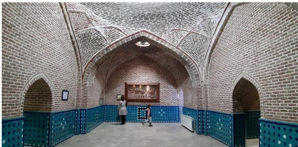
حمام قجر قزوین

جاهای دیدنی قزوین بخصوص حمام قجر قزوین محبوبیت زیادی میان گردشگران و توریست های ایرانی و خارجی دارد. علت این محبوبیت قدمت های زیاد و معماری های جالبی است که این بنای تاریخی دارد. حمام قجر قزوین در نزدیکی سیزه میدان، که قلب بناهای تاریخی شهر قزوین می باشد، واقع شده است. و در نزدیکی آن چند بنای تاریخی دیگر مانند کاروانسرای سعد السلطنه و کاخ چهل ستون قزوین وجود دارد، شما می توانید بعد از بازدید از حمام قجر قزوین از دیگر بناهای تاریخی این شهر هم دیدن کنید. حمام قجر با شماره ثبت ۱۲۶۰۱ و در تاریخ ۱۱ مرداد ماه، سال ۱۳۸۴ هجری شمی به عنوان یکی از آثار باستانی و ملی ایران به ثبت رسیده است. اگر شما هم جزو گردشگرانی هستید که به بناهای تاریخی علاقه مندید به شما توصیه میکنیم حتما از حمام قجر قزوین دیدن کنید.