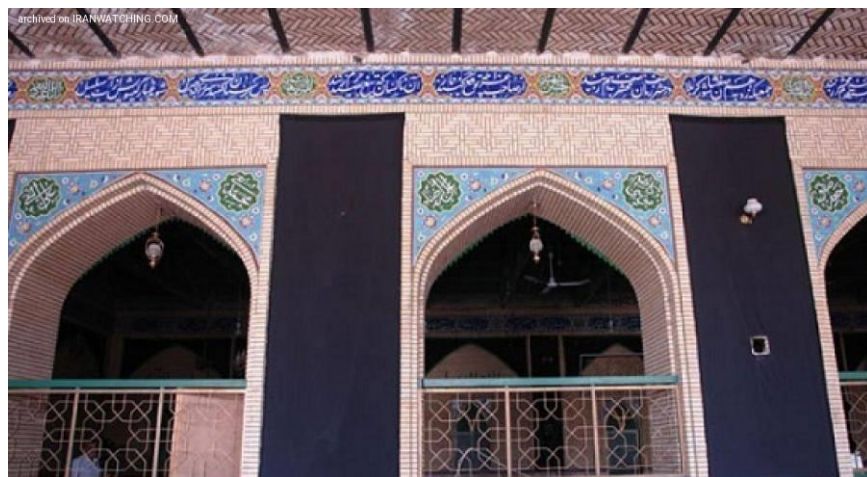
حسینی یزدی ها زاهدان

جاهای دیدنی زاهدان اکثراً از معماری یزدی برگرفته شده اند. و حسینیه یزدی ها نگین جاهای دیدنی زاهدان است. و معرف معماری یزدی در این شهر می باشد. و بیشتر معماران جاهای دیدنی زاهدان هم استادانی از شهر یزد بودند. مردم شهر زاهدان به معماری شهر یزد علاقه ی زیادی داشتند، و اگر در صدد ساخت بنایی بودند که انتظار میرفت، این مکان قرار است به جاهای دیدنی زاهدان تبدیل شود، سفارش ساخت آن را به معماران یزدی میسپردند. حسینیه یزدی ها، همانطور که از اسمش پیداست و نگین جاهای دیدنی زاهدان است هم از این قضیه مستثنی نیست. البته حکایت هایی هم وجود دارد، که میگوید اولین مهاجران به شهر زاهدان یزدی ها بوده اند، ممکن است که دلیل معماری یزدی در جاهای دیدنی زاهدان، همین حکایت باشد. حسینیه یزدی ها زاهدان، در ماه محرم شور و حال عجیبی دارد. و مراسمات مربوط به این ماه و عزاداری امام حسین (ع)، به خوبی در این مکان برگزار میشود. اگر قصد سفر به جاهای دیدنی زاهدان را دارید، پیشنهاد ما این است که در ماه محرم به این سفر بروید، چون در کنار بازدید از جاهای دیدنی زاهدان، میتوانید به حسینی یزدی ها نگین جاهای دیدنی زاهدان بروید و برای امام حسین (ع) عزاداری کنید و با حس و حال معنوی حاکم درحسینیه روح خود را جلا بدهید.