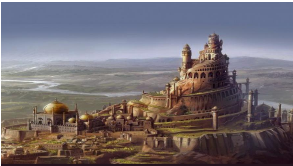
نقاشی بازسازی شده قلعه الموت

جاهای دیدنی قزوین بسیار است، اما قلعه الموت مشهورترین آن هاست. مشهوریت قلعه الموت حتی به بیرون مرزها هم رسیده. اگر اهل گیم باشید حتما بازی هایی مانند: شن های زمان، اسپین کرید و شاهزاده ایرانی را بازی کرده اید. در این بازی ها به زیبایی قلعه الموت قزوین را به تصویر کشیده اند. این قلعه آنقدر مهم است که حتی مشهوریت آن به برون مرزهای کشورمان هم رسیده است. علت محبوبیت و مشهور بودن قلعه الموت قزوین، معماری بینظیر و قدمت آن است. بدلیل قدمت بالای این قلعه کارشناسان و باستان شناسان علاقه ی بسیار زیادی به این بنا دارند. استان قزوین، مکان ها و بناهای تاریخی خیلی زیادی دارد. اگر به استان قزوین سفر کردید، حتما از جاهای تاریخی این شهر مانند: بازار قزوین، سردر عالی قاپو و... دیدن کنید.