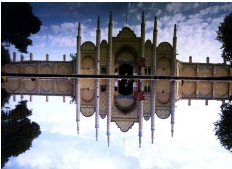
امام زاده شاهزاده حسین (ع)

جاهای دیدنی قزوین بناهای اسلامی را هم شامل میشود مانند امامزاده شاهزاده حسین (ع) و مسجد جامع قزوین. هر کدام از این بناهای تاریخی در نوع خود جالب و دیدنی می باشند و حتما باید آن ها را دید. ما امروز در این مطلب به معرفی امام زاده شاهزاده حسین (ع) میپردازیم. در این بنای اسلامی و تاریخی شهر قزوین مقبره ی شاهزاده امام حسین (ع)، فرزند علی ابن موسی الرضا (ع) قرار گرفته است. هر ساله تعداد زیادی از مسلمانان از جای جای دنیا برای زیارت امام زاده شاهزاده حسین (ع) به شهر قزوین سفر میکنند. همچنین گردشگرانی که حتی دین آن ها اسلام نیست هم به بازدید از این بنای تاریخی میپردازند. امام زاده شاهزاده حسین (ع) در تاریخ ۲۰ بهمن ماه سال ۱۳۱۸ هجری شمسی با شماره ثبت ۳۳۹ جزو آثار ملی و تاریخی ایران به ثبت رسیده است. در ادامه بیشتر به تاریخچه و معماری این بنا میپردازیم.