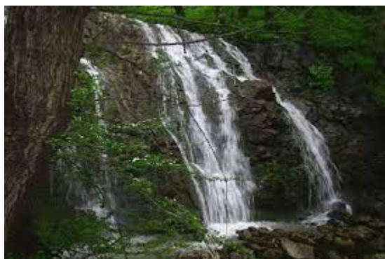
آبشار شارشار زنجان

آبشار شارشار گیسوی زیبای زنجان می باشد. آبشار شارشار همانند دختری زیباست که گیسوان بلند و زیبای خود را در آغوش شهر زنجان جای داده است. اگر به جاهای دیدنی زنجان سفر کردید حتماً به این آبشار زیبا هم سری بزنید و روح خود را درون این طبیعت زیبا جلا بدهید. این آبشار در شمال شرقی جاهای دیدنی زنجان در محله ای بنام تهم قرار گرفته است. درست است، که این شهر دارای چشمه های آب معدنی و چشمه های آب گرم می باشد که جزو جاهای دیدنی زنجان هستند. اما آبشار شارشار گیسوی زیبای زنجان، تنها آبشار این شهر می باشد و حالا جزو جاهای دیدنی زنجان محسوب می شود. اما متأسفانه بدلیل سد سازی قرار است همین یک آبشار هم از بین برود. پس زودتر به جاهای دیدنی زنجان سفر کنید و از دیدن این آبشار زیبا لذت ببرید.